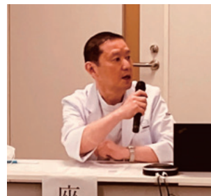
座長:大成主任部長