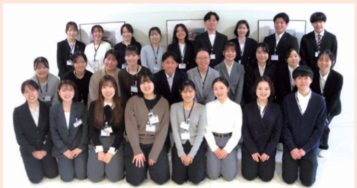
研修中の新入社員の皆さん

マツダ病院に、看護師、臨床検査技師、理学療法士、作業療法士、管理栄養士の新たな仲間が加わりました。今後も「選ばれ愛される病院」を目指し共に進んで参ります。よろしくお願い致します。