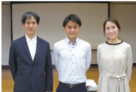
講演を担当した看護師メンバー