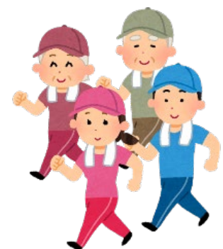
表 運動療法ガイドライン

運動の種類：有酸素運動 運動の頻度：できれば毎日、少なくとも週3~5回 運動の強度：中等度（ややきつい） 持続時間：20~60分