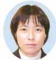
精神科神経科 安常 香